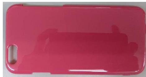
スマートフォンケース