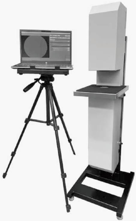
ルケオのLSC-5100。透明なガラスや水晶板の不均一な部分（脈理）などを検出する