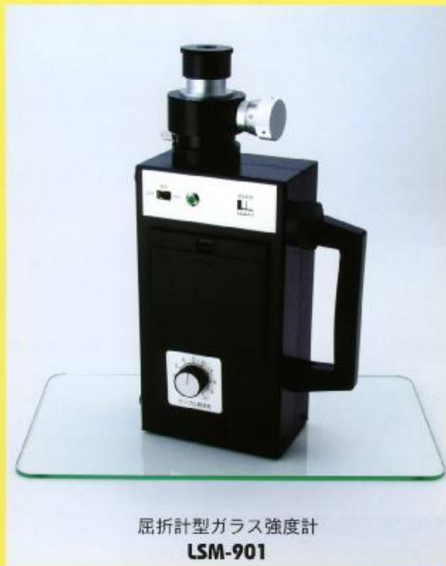
屈折計型ガラス強度計 LSM-901